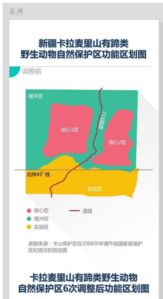
附录 1 新疆卡拉麦里山有蹄类野生动物保护区功能区调整对比图 (资料来源: http://news.qq.com/a/20150609/024433.htm?tu_biz=1.114.2.1 )