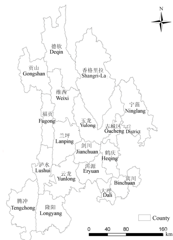
图1 开展生物多样性本底调查的滇西北18县市区分布图 Fig. 1 Map for 18 counties of the biodiversity background survey at the county level in Northwest Yunnan

谷,具有明显而完整的地带垂直带谱,特殊的地形地貌和复杂多样的气候使该区域成为全球生物多样性最为丰富的地区之一(张燕妮等, 2013); 同时,还是《中国生物多样性保护战略与行动计划(2011–2030年)》划定的32个陆地生物多样性保护优先区的部分区域。滇西北在自然区域上属于喜马拉雅山系东部的横断山脉纵谷区,地形地貌特殊,气候复杂多样,拥有中国近1/3的高等植物和动物种数,属中国三大特有物种起源和分化中心区域,分布着丰富而多样化的基因资源和动植物类群,保存有大量古老的生物类群,是中国原生生态系统保留最完好、垂直生态系统最完整以及全球温带生态系统最具代表性的地区。